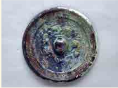
ひろみね 広峯 15号墳(福知山市)出土 けいしよよねのめいぼんりゆうきょう 景初四年銘盤龍鏡(重文)福知山市教育委員会蔵

今回の特別展では、丹後地域に出現した強大な政権をはじめ、丹波(タニワ)の各地に息づいた地域政権の興亡について、出土品や写真パネルで紹介します。会期は11月23日(火)までです。